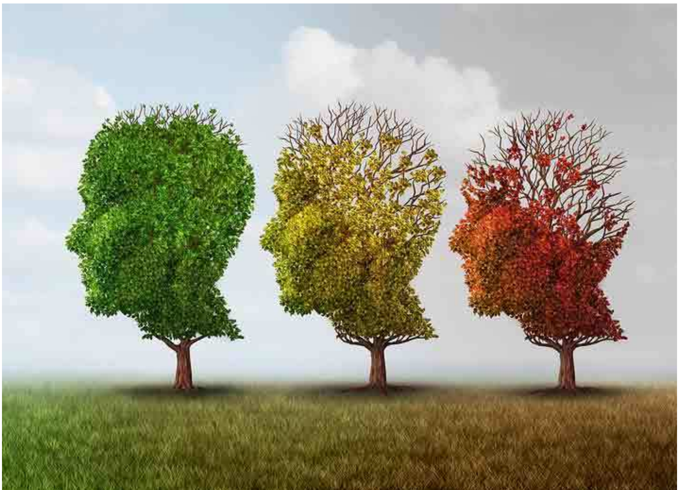
Alzheimer – die Krankheit des langsamen Vergehens

Alois Alzheimer identifizierte im Jahr 1906 als erster die Symptome, die wir heute als Alzheimer-Krankheit kennen. Die Krankheit um die es geht, ist durch die Namensgebung für immer untrennbar mit seiner Person verbunden.