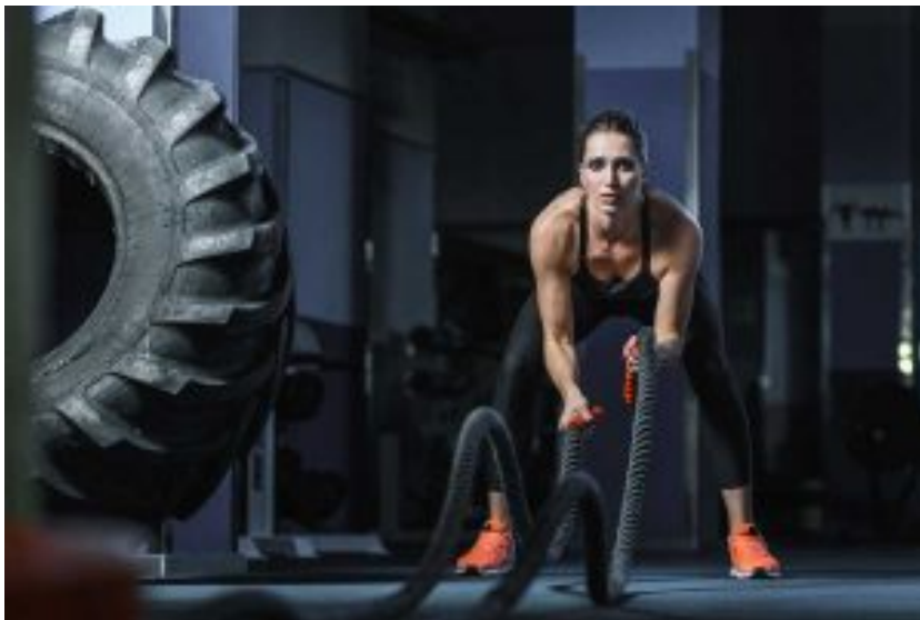
Battle Rope – Training

Mit fetten Tauen fette Muskeln aufbauen und dabei Fett verbrennen!